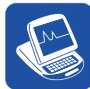
• ベースメーカープログラマー