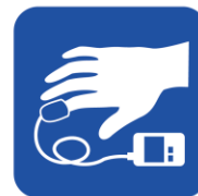
• パルスオキシメータ • バイタルサインモニター