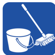
• バケツ • モップ等