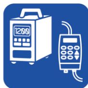
• 輸液ポンプ (とくにACアダプター) • 輸液ライン用キャップ