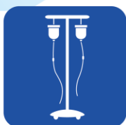
• 点滴台 • Jバッグ