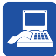
• MR検査で影響を受ける恐れのある医療機器