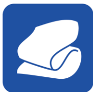
• サーマフレクト毛布 (アルミ裏打ち毛布)