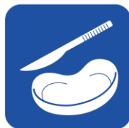
• 医療用鋼製小物 (メス・留置針) • 膿ぼん