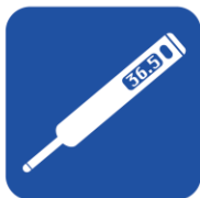
• 体温計 • 血圧計 • 電極類