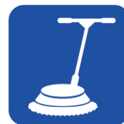
• 掃除用具 • ポリッシャー